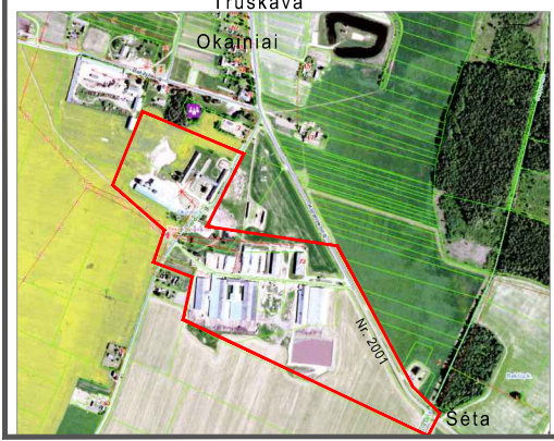
Situacijos schema Truskava